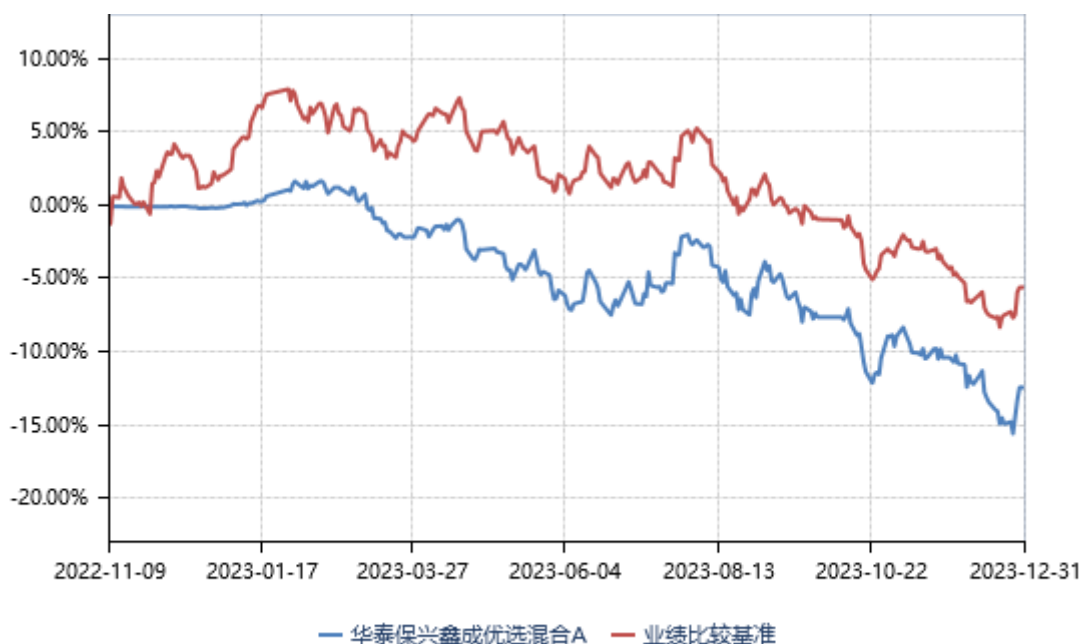
华泰保兴鑫成优选混合A